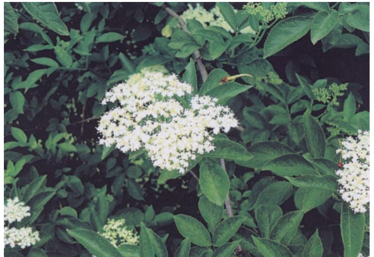
Fig. 1 / Flor de xabú o Benitu ( Sambucus nigra ) coyíase per San Xuan

Na camera, na cabana, pa quitar les pulgues poníase la flor mariella que da la escoba, que tamién se llama cádaba y grumu. Nun ye que matare les pulgues pero nun-yos gustaba esi olor y asina colaben.