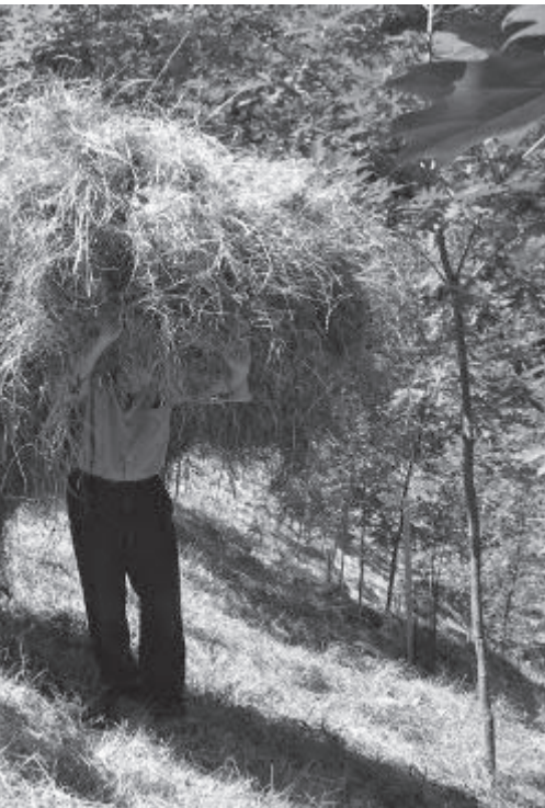
4 / Segando a guadaña. 5 / Cabruñando. 6 / Carga yerba.

aún estaba presente el rocío. A esa hora se cortaba bien la hierba, no ahogaba el calor, y se evitaba la costra parda que con el sol se formaba en el envés de la guadaña. Con ella al hombro y el gaxepu al cinto se dirigían a la cota de siega. Generalmente segaban un prado en estayes , calzando los segadores madreñas o katiuskas . Cada segador abría una calle dejando a la izquierda una hilera de hierba o marellu , más o menos grande dependiendo de la calidad del terreno y la abundancia de estiércol. A este respecto comentaban los paisanos con humor: « Dios y el cucho puein muncho, pero sobre too el cucho ».