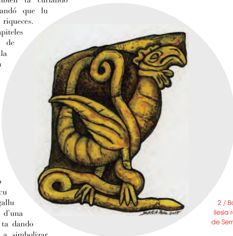
2 / Basiliscu nun capitel de la ilesia románica de San Vicente de Serrapio (Ayer).

Pierre de Beauvais, también nomáu Pierre le Picard (1206) fala d'una sierpe nacida del güevu'l gallu que vivía na faldada de la peña Orduña, sacaba una llingua de fueu, echaba velenu pelos güeyos y comía a la xente. Diz que la Virxe tuvo que mandar un ánxel pa que la achuquinare. Hasta equí delles ringleres d'un mitu cuasi escaeciú.