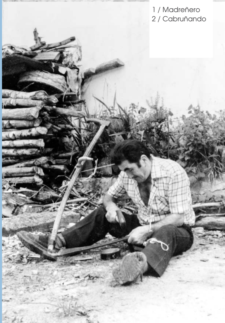
1 / Madreñero 2 / Cabruñando