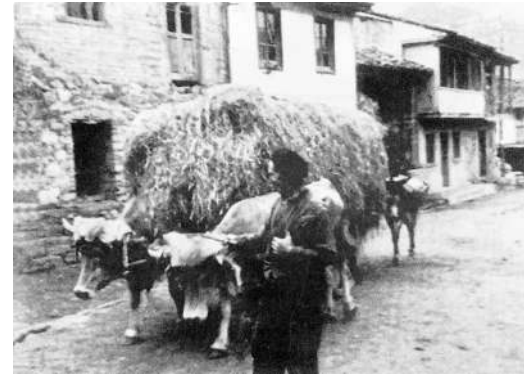
4 / Querru del país

Las bernas recoyíanse pa colocar en las puertias de las viviendas y establos.